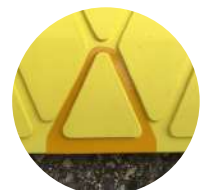
Reflektoren von oben