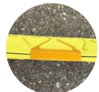
Reflektoren von vorne