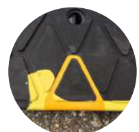
Reflektoren von unten